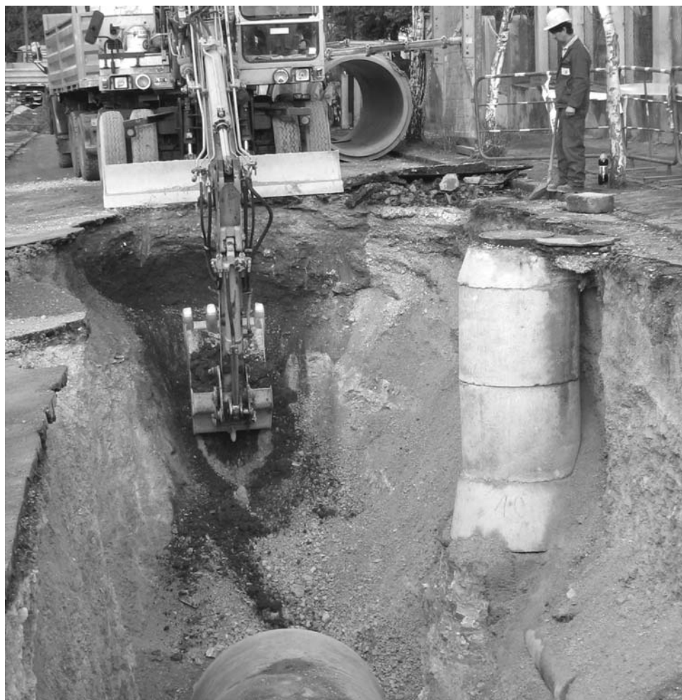
Ilyen és ennél még mélyebb árkok szelték volna át Veszprém belvárosát, ha nem a fúrési technológia mellett döntenek

elkészültek a kiviteli tervek is. Az építési munkák befejezésének időpontja, szerződés szerint: 2007. december 31.