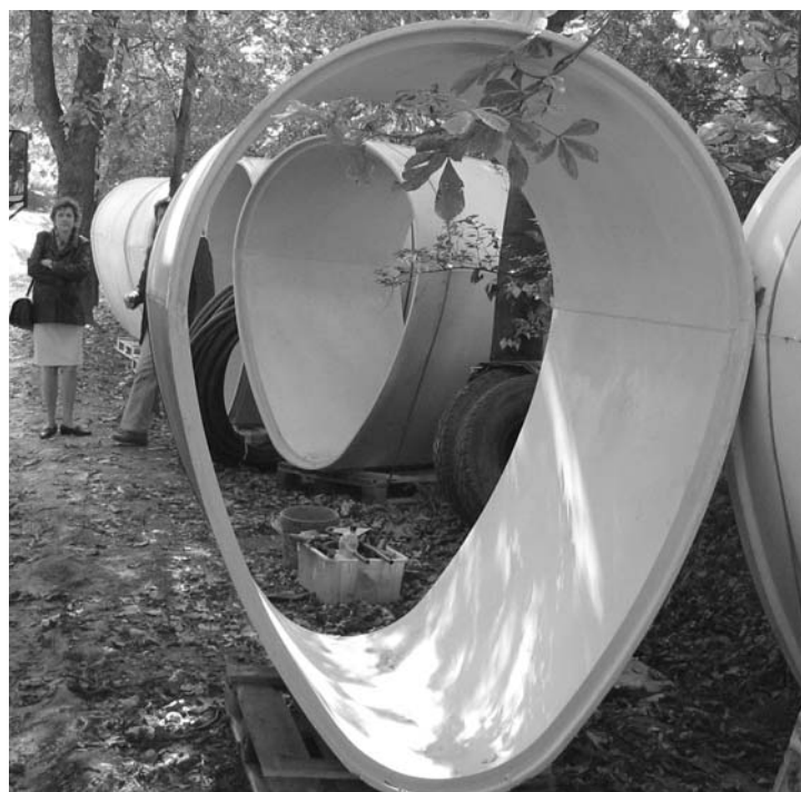
Tojás alakú elemekből építették ki az új veszprémi csapadékvíz gerincvezetékét. Beszámolunk lapunkban a kohéziós alap finanszírozta munkálatok időszerű állásáról