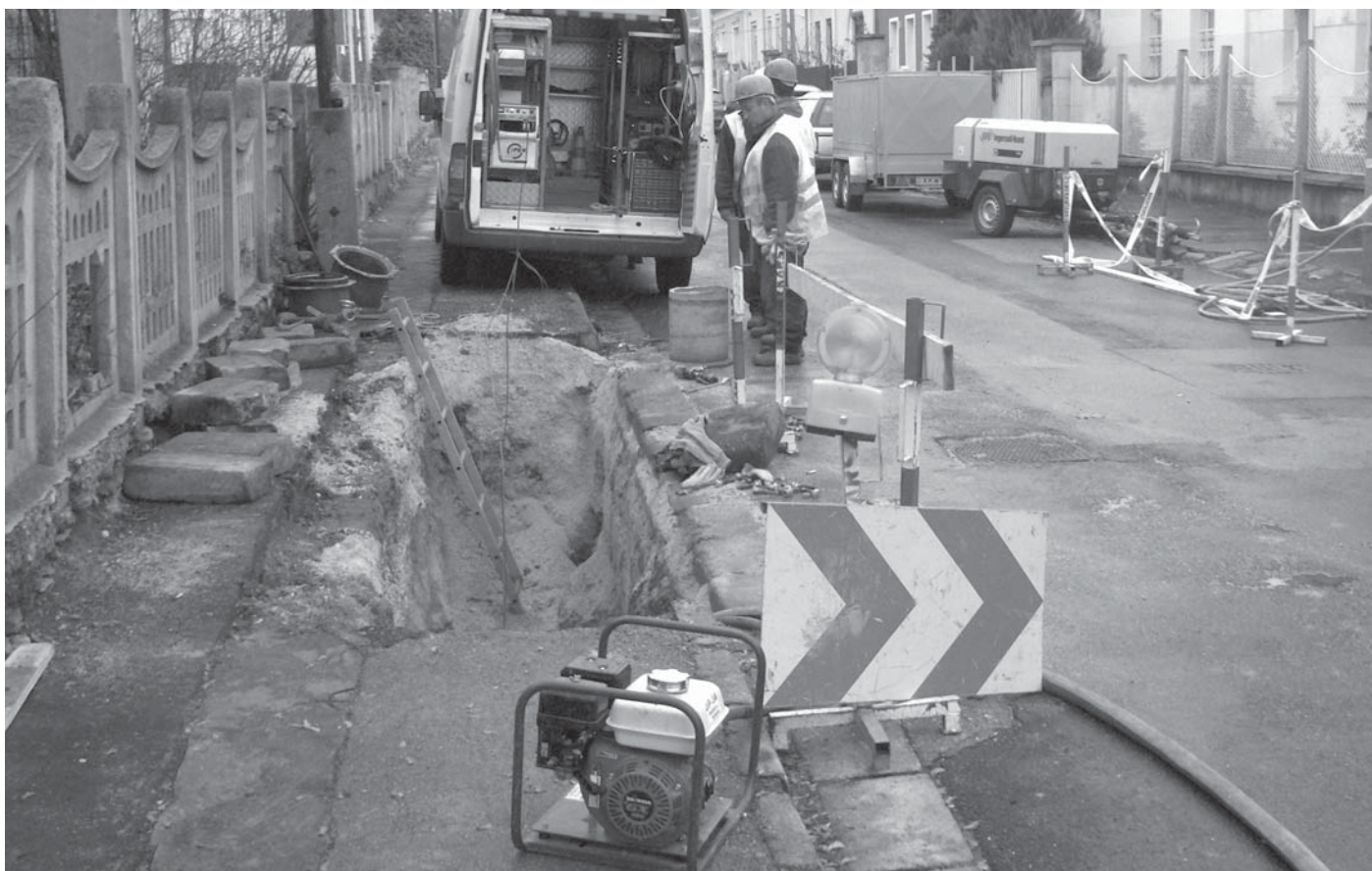
A megyeszékhelyen tíz utcában köztük a Rózsa utcában (képünkön) cserélnek vezeték