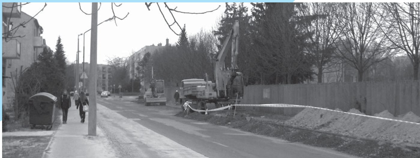
Ivóvíz vezeték rekonstrukció a veszprémi stadion mellett, a Wartha Vince utcában