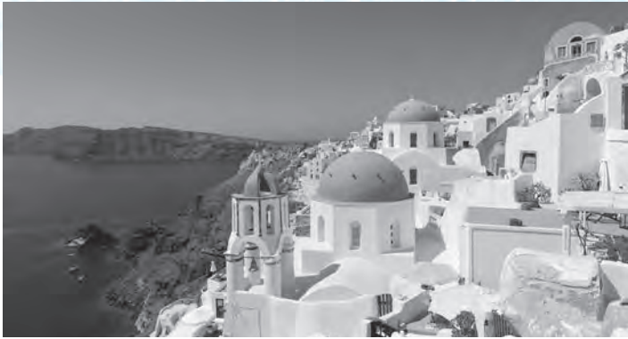
Kréta - Santorini

Az elmúlt bő egy évtized alatt immár hatodik alkalommal indultunk Palotáról újabb nyaralásunk színhelye felé, ezúttal Kréta szigetére. Csatlakoztak hozzánk munkatársak Ajkáról és Veszprémből, valamint a „Vízmű bálók” tombola fődíjainak nyertesei is. Velük kiegészülve, nem engedve a negyvennyolcból – ennyi lett a csoport létszáma – indultunk szeptember 20-án kora hajnalban a repülőtérre.